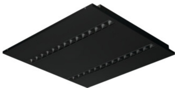
OS RST B P1