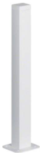
tehalit.DA200 Minikolumna jednostronna DA200-45 H=650mm biały