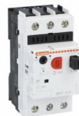
Wyłącznik silnikowy SM1P