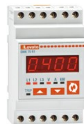
Urządzenia pomiarowe – Woltomierz, amperomierz i watomierz DMK75R1 3