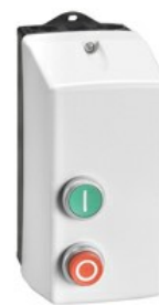
Rozrusznik bezpośredni M1P00910