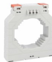
Przekładniki prądowe DM4T1500