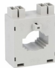
Przekładniki prądowe DM2T0150