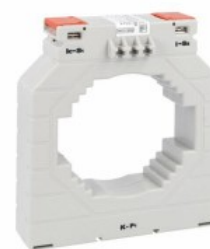
Przekładniki prądowe DM4T1000