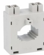
Przekładniki prądowe DM2T0100