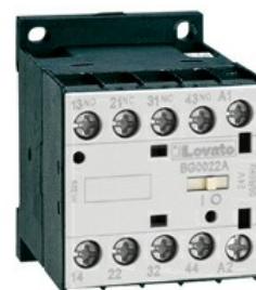
Stycznik pomocniczy BG00