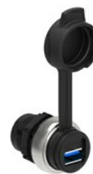
Interfejs USB, połączenie żeńskie A/B LPCD0