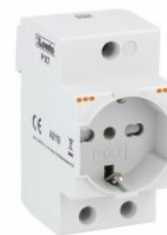
Gniazdo modułowe, standard włoski i niemiecki (Schuko); 16A. P1X7 2.5