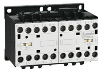
Styczniki w układzie nawrotnym BGT12