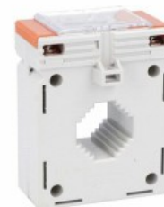
Przekładniki prądowe DM1TP0400