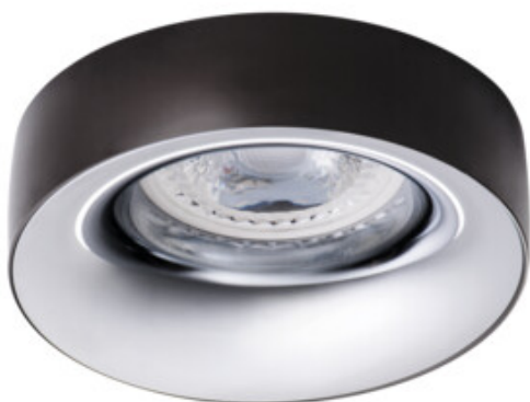
ELNIS L A/C